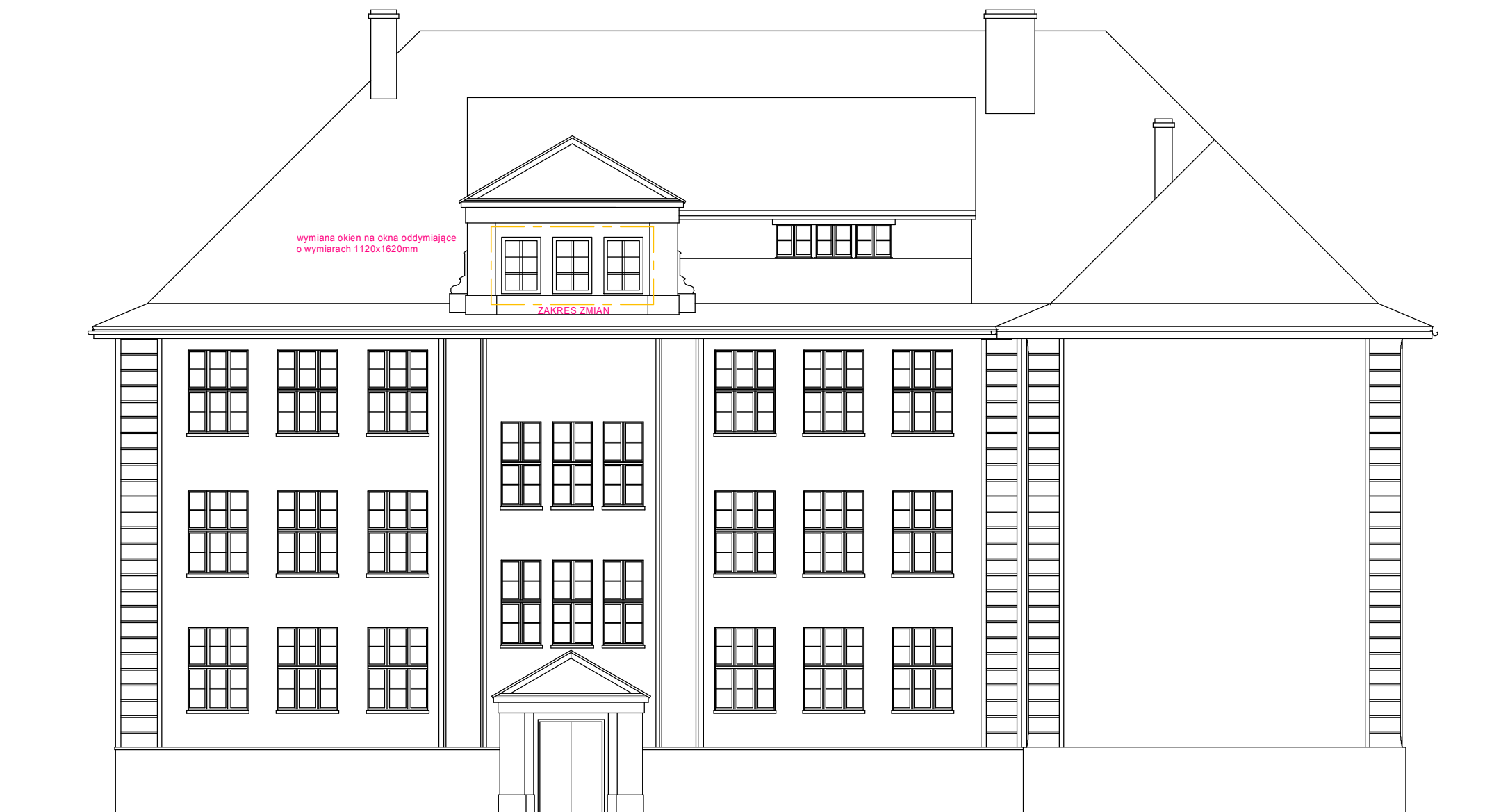
ELEWACJA TYLNA CZĘŚCI FRONTOWEJ BUDYNKU