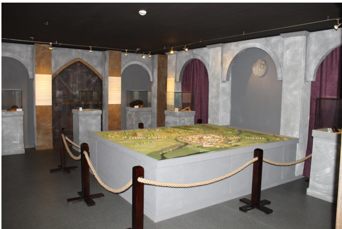
Rysunek 4Widok na wnękę nad dioramą oraz umiejscowienie dioramą