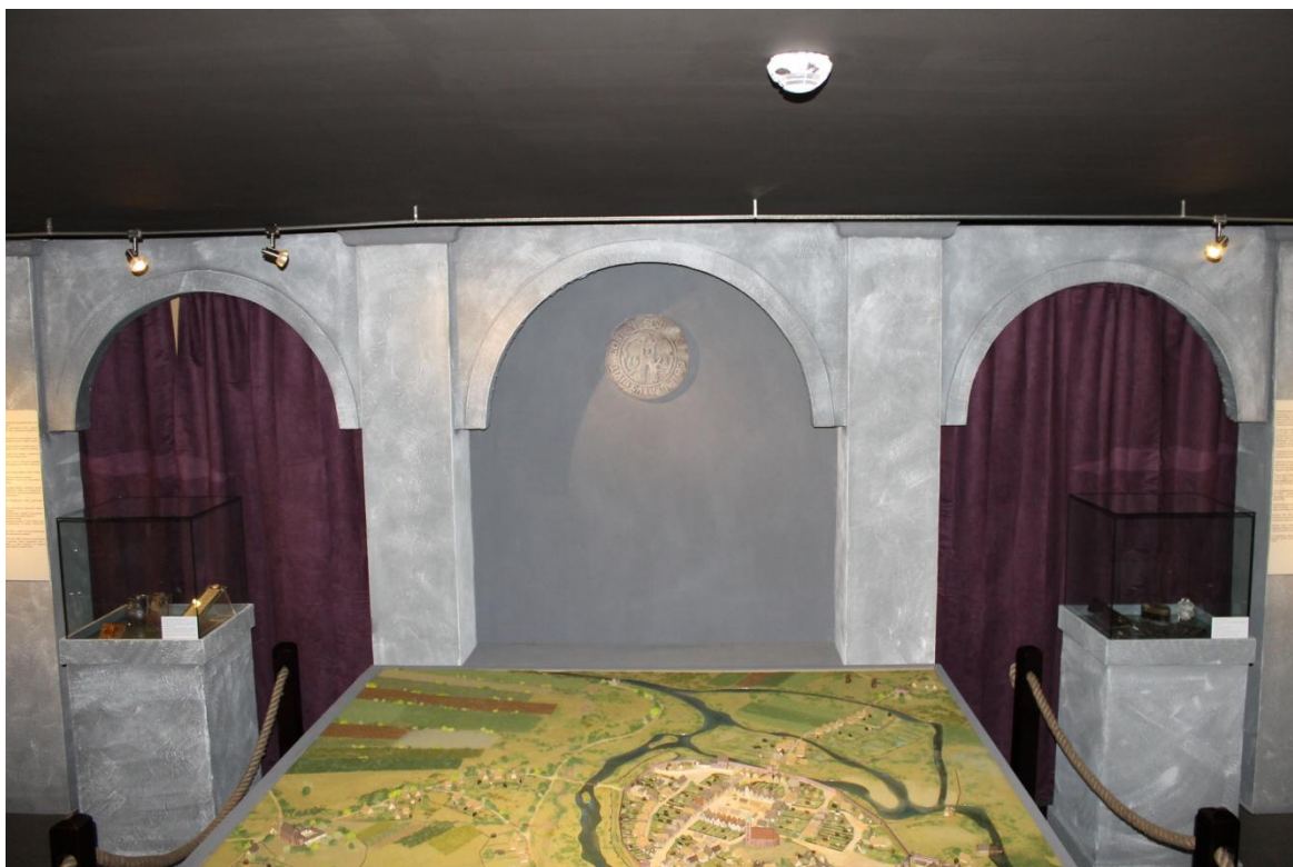
Rysunek 3 Wnęka nad dioramą - zdjęcie zrobione ok 20 cm od sufitu