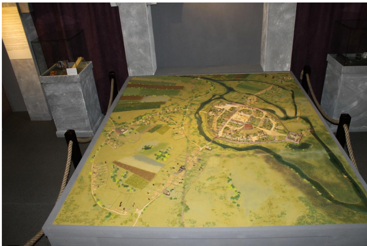
Rysunek 1 Widok makiety - zdjęcie zrobione z ok 20 cm od sufitu