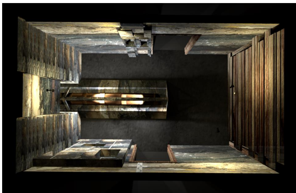
Rzut pomieszczenia z widoczną centralnie usytuowaną rurą wodociągową, drewnianym szalunkiem oraz zaaranżowanymi w formie wykopu archeologicznego ścianami z widocznymi wkomponowanymi gablotami