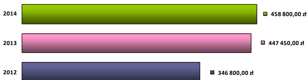
Wykres nr 2: Wysokość dotacji przyznanych organizacjom pozarządowym w latach 2012 - 2014

Zlecenie realizacji zadań Gminy Miejskiej Kościan organizacjom pozarządowym oraz innym podmiotom uprawnionym w 2014 roku następowało w dwóch formach: